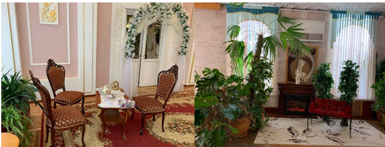
Гостиная примирения ждет гостей

Первая в регионе Гостиная примирения отмечает год работы. Ее открытие во Владимирском Дворце бракосочетания стало прорывом в развитии примирительных технологий в регионе – медиация вошла в общественную практику. Сегодня эффективность урегулирования семейных конфликтов с помощью профессионала не вызывает сомнений.